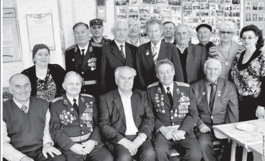
Городской совет ветеранов органов внутренних дел и внутренних войск отменил утвержденный специально для бывших служащих силовых структур праздник.