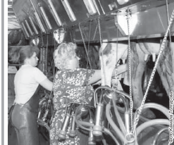
В комплексе «Риал-Агро»