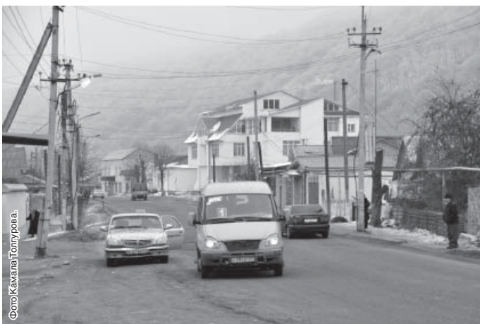
Фото Камалы Толтырова.