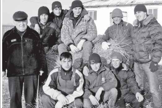
Дружный коллектив завода называют «Фабрикой чемпионов».