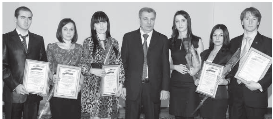
На церемонии вручения свидетельств о назначении стипендии Главы КБР и дипломов лауреатов премии по поддержке талантливой молодежи в рамках приоритетного национального проекта «Образование».

Желаю вам доброго здоровья и благополучия, успехов в учебе и науке, ярких творческих свершений.