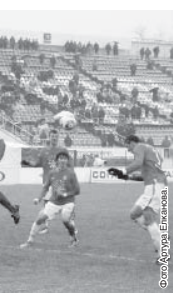
С. Ю. Ю. Ю.

Наша команда атаковала с первых минут. «Амкар» оказался готов к такому сценарию и, отразив несколько наскоков, провел две контратаки, которые могли закончиться взятием ворот. На 20-й минуте Фредрикссон вывел вперед шесть минут уже голкипер нальчичан, продемонстрировав кошачью реакцию, «выдузил» мяч из-под перекладины после плотного удара Михалева. Упущенные моменты расстроили гостей, а хозяева поля стали играть в обороне более четко. В первом тайме удары подали восемь угловых, а всего за матч — 14, защитники «Спартак-Нальчик» не рисковали даже в неопасных ситуациях. Тем временем гости стали острее и точнее, одна из которых завершилась взятием ворот в компенсированное к