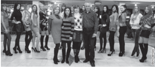
С. Ю. Ю. Ю.

Требования, предъявляемые к конкурсанткам, по уровню соответствуют всероссийскому составу, потому напряжение довольно высоко. Тем не менее корреспонденты «КБП» заметили, что в коллективе подерживаются довольно дружеские отношения, царит атмосфера участия и взаимопомощи. Девушки стараются не показывать, что очень волнуются, упорно работают, серьезно воспринимают замечания и указания к действиям своих наставников. На конкурсе им предстоит продемонстрировать таланты в разных номинациях. Наряду теми, кто готовится к участию в конкурсе, ожидается участие «Мисс Talent» — «Мисс зрительских симпатий»