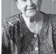
Оюс Натпаши Барисет