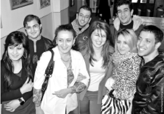
Студенты после экзамена – довольные и счастливые.