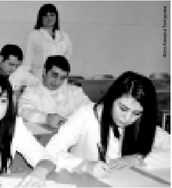
Экзамен по «Гигиене»

что получили хорошую базу знаний на медфаке КБГУ и ничуть не отстали от выпускников других вузов России. Сегодня те, кто успешно закончил сессию, делятся друг с другом впечатлениями в факультетских коридорах. Широко открыты улыбки, смех и веселые разговоры о том, что тяжелой экзаменационный период за-