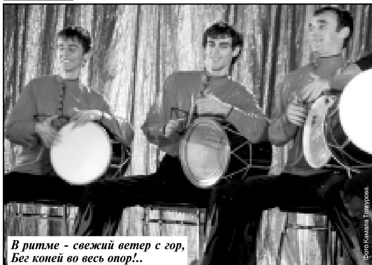
В ритме - свежий ветер с гор, Бег коней во весь опор!..