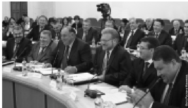
Члены правительства приступили к работе в хорошем настроении.

Арсен Каюков заметил, что в сфере ЖКХ с помощью федерального центра за последние несколько лет сделано много. В частности, реализуется программа реформирования и модернизации жилищно-коммунального хозяйства. Выполняется целый ряд республиканских целевых программ по улучшению водоснабжения населенных пунктов, строительству новых и реконструкции старых школ и медицинских учреждений и т. д. Каюков отметил Президент, перед новым Правительством стоит задача энергосбережения, особенно в бюджетной сфере. Он призвал чиновников всех уровней уделять вопросу особое внимание, поскольку это станет одним из критериев оценки эффективности работы.