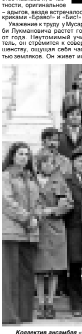
Коллектив ансамбля «Терчанка» - победитель международного фольклорного фестиваля в Ирландии. 1974 г.

посвятили себя искусству народного танца, стали артистами академического ансамбля «Кабардинка», внесли весомую лепту в укрепление авторитета прославленного коллектива.