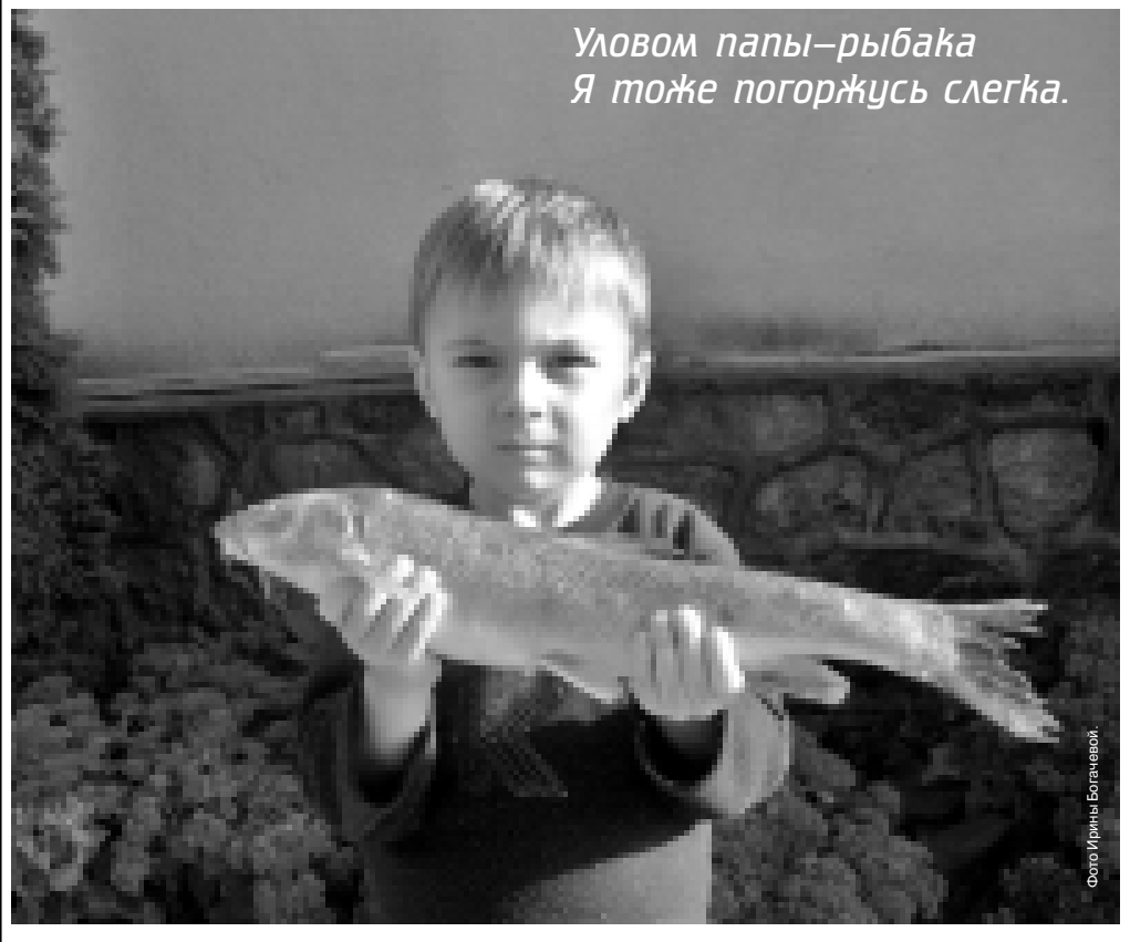
Уловом папы-рыбака Я тоже погоржусь слегка.