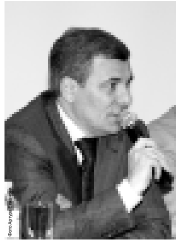
Президент КБР А. Каноков и министр спорта и туризма Аслан Афаунов.