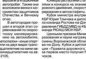
Третий этап «Автоспасс» юные спортсмены проходили на двух видах транспорта: четырнадцатилетние на мини-автомобиле и семнадцатилетние на автомашине ВАЗ-2105.