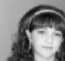
Юные артисты в концертном зале

В Музыкальном театре прошел трехчасовой концерт «Детская волна», в котором приняли участие двадцать юных артистов, представляющих городские коллективы. «Детская волна» - проект продюсерского центра «Эльбрус-Арт», поддерживаемый региональным отделением партии «Единая Россия», благодаря чему на концерте побывали десятки воспитанников интернатов.