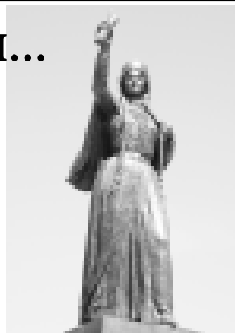
Памятник на площади 400-летия.

В собрании государственных грамот и договоров встречается ряд документов, где князь и бояре «целуют крест своей государыне царице и великой княгине Марье, царевичам Ивану и Федору, детям, которых бог пошлет». Некоторые читатели думают, наверное, о том, были ли совместные дети у Марии Темрюковны и Ивана Грозного? Да, был один ребенок, которого назвали в честь отца Ивана Грозного Василием, но, к сожалению,