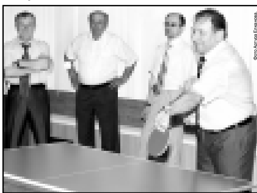
Новые столы поправились министру спорта и туризма Аслану Адаунову.

В Доме культуры села Нижняя Жемтала открыт зал настольного тенниса. В церемонии принял участие министр спорта и туризма КБР Аслан Адаунов и глава администрации Черекского района Махти Темиржанов.