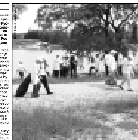
Фотоматериалы рубрики подготовил спортивный обозреватель Альберт ДЫШЕКОВ.

Федеральная природоохранная акция «ОБЕРЕГАЙ!» - часть программы, которую компания «РусГидро» реализует в рамках экологической политики в районах гидроэлектростанций.