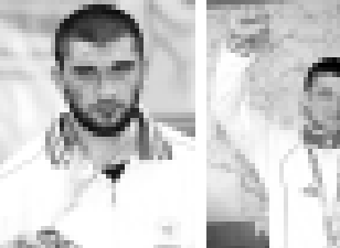
Биллал Махов – чемпион мира по вольной борьбе (2007 г.).