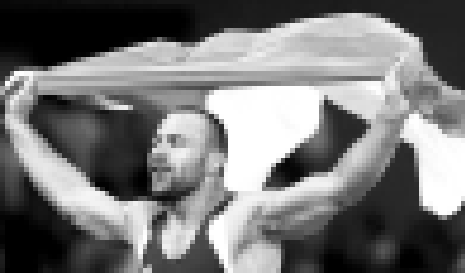
Асланбек Хузтов – чемпион Олимпийских игр в Пекине (2008 г.) по греко-римской борьбе.