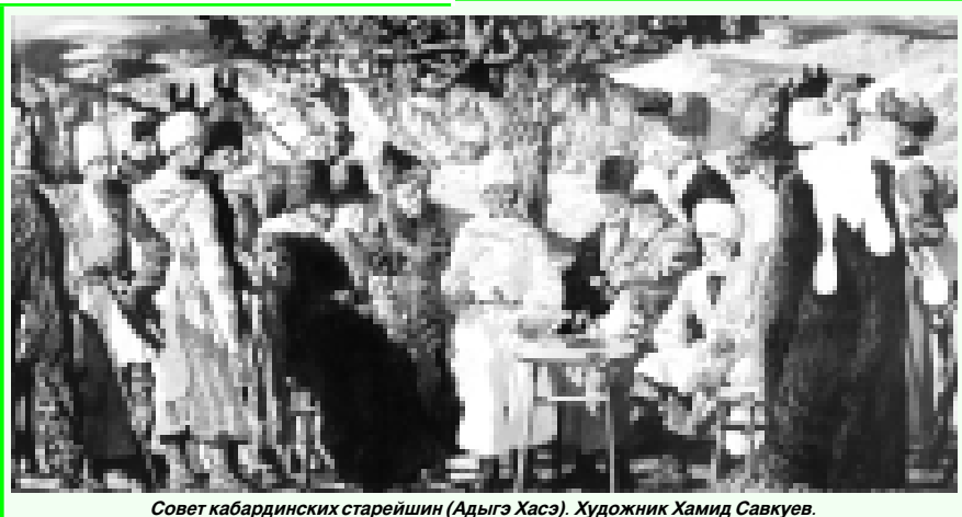
Совет кабардинских старейшин (Адыгэ Хасэ). Художник Хамид Савкуев.