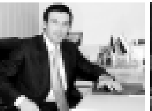
Мурат Карданов – чемпион Олимпийских игр в Сиднее (2000 г.) по греко-римской борьбе.