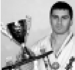
Анзор Шихабов – чемпион мира по карате-киокушинкай (2009 г.).