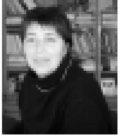
Фатима Тамботова – член-корреспондент РАН, директор Института экологии горных территорий КБНЦ РАН.