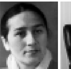
Куна Дышюкова – народная артистка РФ.