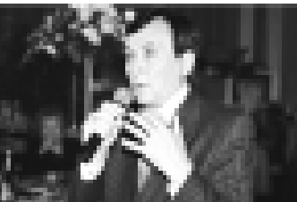
Зур Тугов – заслуженный артист РФ, народный артист КБР.