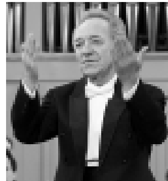
Юрий Темirkanov – народный артист СССР, лауреат Государственных премий РФ и СССР.