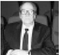
Хасан Карданов – композитор, народный артист РФ.