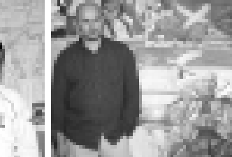
Алим Галанов – обладатель Кубка мира по дзюдо (2008 г.), чемпион Европы (2008 г., 2009 г.).