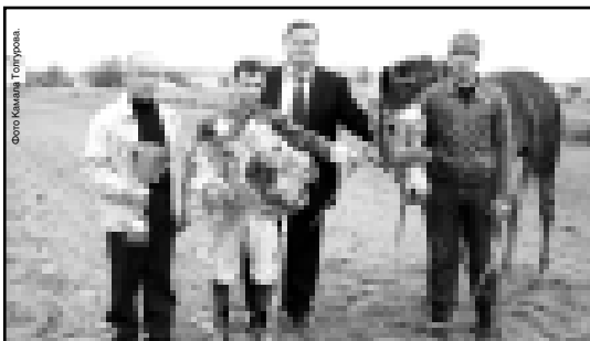
Главный трофей - приз в честь Дня Победы - завоевал Паншам