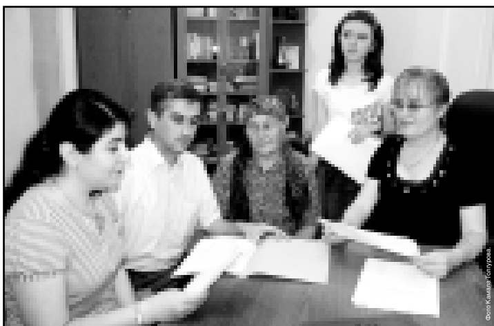
Руководитель Территориального управления труда и социального развития №1 г. Нальчика