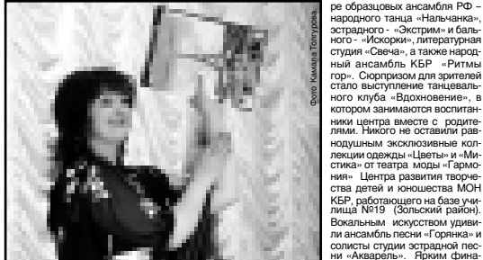
В Государственном концертном зале в этот вечер, что называется, яблоку негде было упасть: зрители, преимущественно молодые, заполнили все места. И им было не так посмотреть. Одинадцать лучших коллективов центра, а это около трехсот артистов, демонстрировали искусство танца, пения, декламации. Мастерством блистали чте-

Так назывался отчетный концерт творческих коллективов Центра развития творчества детей и юношества МОН КБР, приуроченный к Международному Дню защиты детей и прошедший в рамках Года семьи.