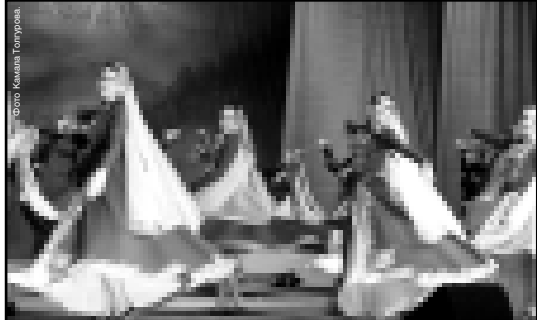
Зал горячо аплодировал каждому выходу танцоров на сцену. Зрители несли артистам букеты цветов, сопровождали их улылками и словами благодарности за достав-

В Музыкальном театре прошел совместный концерт Государственного академического ансамбля танца «Кабардинка» и Государственного танцевально-эстрадного ансамбля Чеченской Республики «Вайнах».