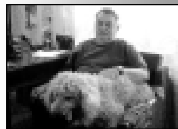
БЫТЬ СЫНОМ МАЛЬБАХОВА

город Нальчик, 16 ноября 2007 года, № 84-УП