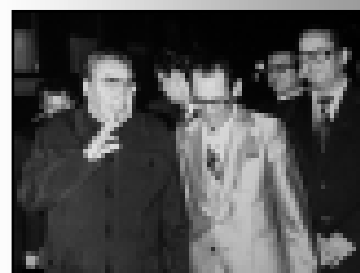
ЛИЧНЫЙ ФОНД МАЛЬБАХОВА