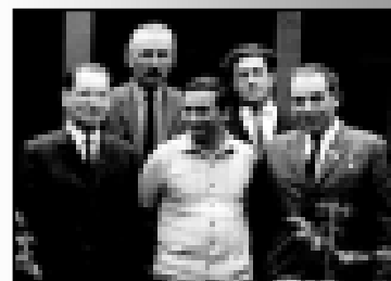
УЧЕННЫЕ КБИГИ О МАЛЬБАХОВЕ