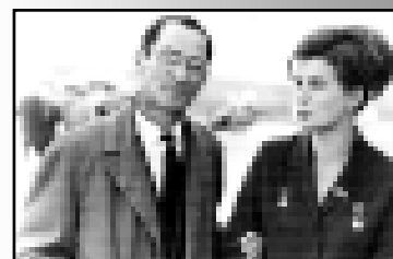
В ПОКОРЕНИИ КОСМОСА УЧАСТВОВАЛА И НАША РЕСПУБЛИКА