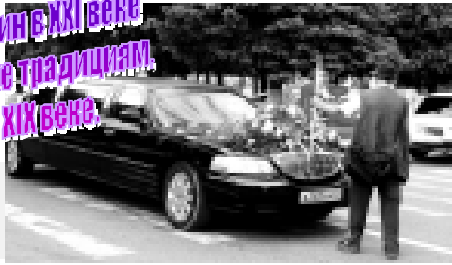
«КБП» ПРОВОДИТ КОНКУРС НА ЛУЧШУЮ ФОТОГРАФИЮ. Останови мгновение и пришли свой снимок.

Свадебный лимузин в XXI веке подчиняется тем же традициям, что и фаэтон в XIX веке.