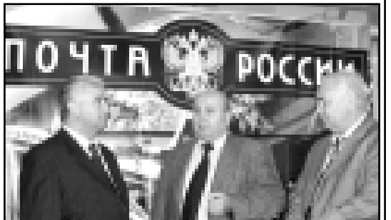
(Окончание. Начало на 1-й с.)

В почтовых корпоративных изданиях нередко встречаются утверждение «Почта меняется». Какие перемены происходят в почтовом мире Кабардино-Балкарской Республики?