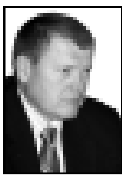
(Окончание. Начало на 1-й с.)

Юрий Викторович, возглавляет комитет по бюджету и налогам в Госдуме, где формируются экономическая основа страны и создается закон, от которого зависит устойчивость всех малых бюджетов. Как вы вступили на финансово-налоговую стезю?