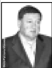
Руслан ФИРОВ, министр курортов и туризма КБР