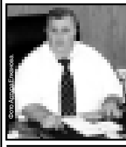
Казим УНАЕВ, министр промышленности, ТЭК и ЖКХ КБР