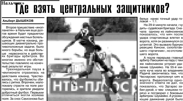
«Спартак-Нальчик» - «Сатурн»

ЦИТАТА НА ПЕРВОЙ СТРАНИЦЕ ВПИСАНА дежурному по номеру. РЕДАКЦИЯ НЕ ВСТУПАЕТ В ПЕРИСКУ С АВТОРАМИ. Рукописи не рецензируются и не возвращаются.