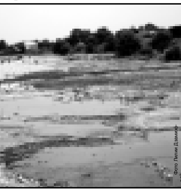
Водопад в долине Баксана.

ло не изменится вновь, а в противном случае выходы с точки зрения экологии. К тому же потребуются тяжелая техника, опять же немалые средства...»