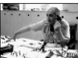
Светофоры на улице.