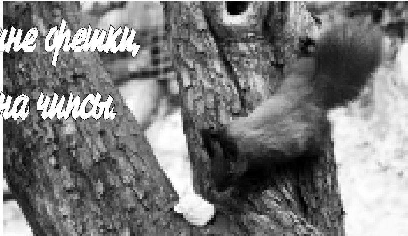
Фото Ильи АХОБЕКОВА, г. Нальчик.