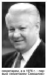
секретарем, а в 1976 г. - первым секретарем Свердловского

Вчера в Москве скоропостижно скончался первый Президент России Борис Ельцин. Об этом сообщила пресс-служба главы Российского государства. По неофициальным данным, смерть была вызвана остановкой сердца. Б. Ельцин родился 1 февраля 1931 г. в селе Бутка Талицко-го района Свердловской области. В 1955 г. окончил строительный факультет Уральского политехнического института им. Кирова. После вуза работал по специальности, пройдя путь от мастера до директора Свердловского домостроительного комбината. В 1961 г. Б. Ельцин вступил в КПСС, а в 1968 г. был приглашен на партию работу. В 1975 г. Б. Ельцин был назначен