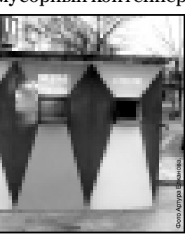
«Искожа» воспринимали как пункт приема мусора, отходы, стекла и пластика. Кто-то даже выкинул в контейнер мусор, но это не является положительным примером.