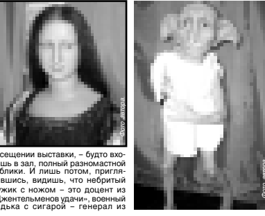
посещении выставки, - будто вошел в зал, полный разнообразной публики. И лишь потом, приглядевшись, видишь, что небритый мужик с ножом - это доцент из «Джентельменов удачи», военный генерал из

В нашу республику снова приехал Музей восточных фигур из Санкт-Петербурга. Созданный в 1988 году как передвижная выставка, он колесит по миру, публикуя успехом. Музей насчитывает около 200 экспонатов, только 80 из которых представлены российскому зрителю. «Чтобы попасть в музей Мадам Тюссо, надо ехать в Лондон, а наши куклы гастролируют, что называется, с доставкой на дом», - горлорепит представитель музея Олег Говорит. Ему одному ведомы маленькие тайны и секреты его полюбивших. Рассказывая о восковой фигурке какой-нибудь знаменитости, Олег разговаривает с ней, как с живым. И правда, первое впечатление, возникающее при