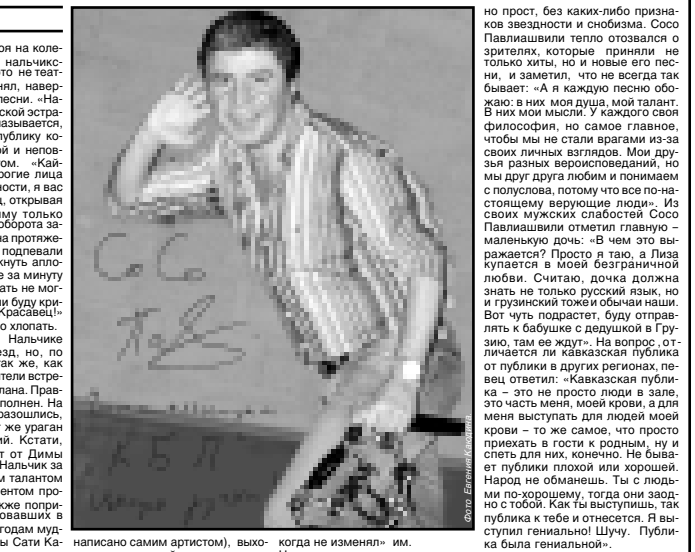
Сосо Павлиашвили, стоя на колени, поприветствовал зал... (Caption text continues)

Сосо Павлиашвили, стоя на колени, поприветствовал зал, полностью, завоевав публику колоссальной энергетикой и неповторимым темпераментом. «Кавказский национализм, я вас люблю!» — сказал певец, открыв дуэтом программу только живого пения и с полуоборота завел зрителей, которые на протяжении всего выступления подпевали ему и не давали смекнуть артисту диссонантам. А ведь еще за минуту до концерта я и подумала не могла, что вместе со всеми буду кричать: «Браво, Сосо!» «Красавчик!» и при этом восторженно хлопала. За последние время в Нальчике побывало немало звезд, но, по моим наблюдениям, так же, как Сосо Павлиашвили, артисты встречаются разве что Диму Билана. Правда, тогда зал был переполнен. На этот раз не все билеты разошлись, но в зале бушевал тот же ураган эмоций. Сосо пел новые — при этом и старые песни (как всегда подавляющее большинство из них — написано самим артистом), выходил в зрительный зал, поминутно выходя к публике, как будто желая клясться в любви и уверял, что «ни когда не изменял» им.