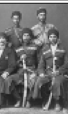
Группа черкесов с турецким офицером.