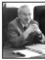
Юрий Мауров, председатель Верховного Суда КБР.

Я в курсе, какое мнение на этот счет есть у населения. Обычно молва не возникает на пустом месте. И, в общем, исходя из существующей реальности, можно допустить, что судебная система так же, как и все остальные общественные институты, коррумпирована.