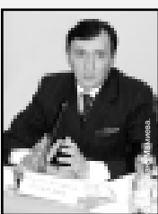
«Кабардино-Балкарская правда» обратилась в министерство культуры и информационных коммуникаций в коррумпированной сфере культуры?»

Вот что ответил на вопрос газетчик министр Зарр Тутов: «О своем ведомстве я могу сказать только то, что и без моих слов очевидно...»