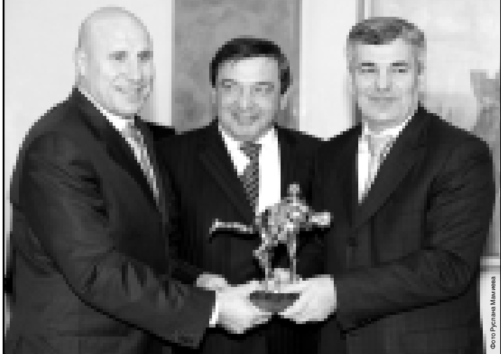
Президент Федерации спортивной борьбы России Михаил Мамашвили и помощник руководителя Администрации Президента РФ, вице-президент Федерации спортивной борьбы России Назир Халирбеков вручили Президенту КБР Арсену Каночеву - Победный бросок Александра Карелина - символ спортивной борьбы.