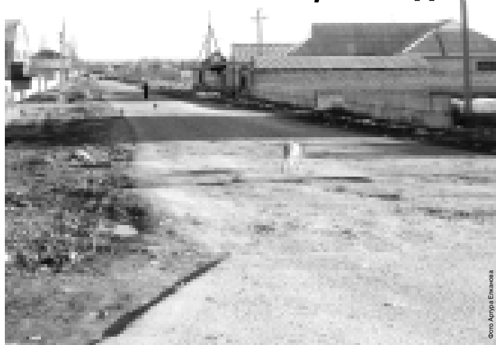
Улица Бадьноко - граница между Сатаней и Адиюх