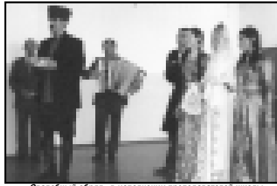
«Свадебный обряд» в исполнении преподавателей школы села Ташлы-Тала.