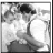
Подарки детям раздавали веселые клоуны комик-театра «Юмикс».