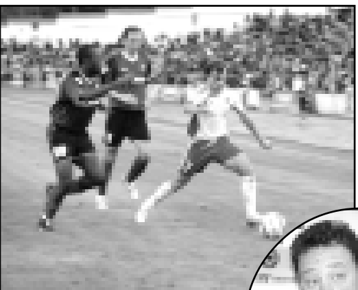
Активность Гогуа вышла ему боком - хавбека удалили.