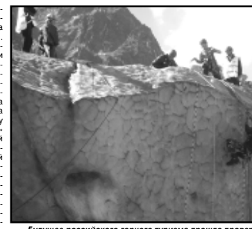
Будущее российского горного туризма прошло проверку в идеальных условиях.

мог бы и не состояться. Организаторы планировали провести чемпионат где-нибудь на скалодроме в Подмоскowie.