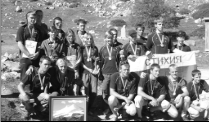
Лучше гор может быть только дружба. Это на память и победителей, и побежденных.

(Окончание. Начало на 1-й с.) Сильнейшими на двух дистанциях - «Лед» и «Спасательные работы» - была команда из Ростовской области «Планета-1».