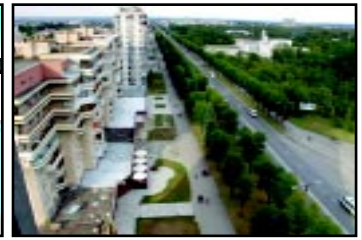
Проспект им. Ленина сегодня.