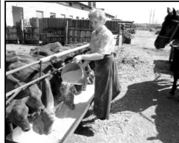
«Хозяйка, мне бы тоже теллячьего деликатеса!» (около 3 тысяч рублей!) Валерий Алексеевич, рассчитавшись с долгами, намерен повысить. Словом, «Красная нива», пусть и не космическими темпами, но выходит из кризиса. Будущее хозяйства выглядит оптимистично. Альберт ДЫШКОВ.

рекали хозяйству низкие урожаи. Работу Валерию Алексеевичу пришлось начинать с пожарных мер. Для того, чтобы нормально завершить зимовку скота, он одолжил в ЗАО РП «Ново-Ивановское» тысячу тонн силоса. Была погашена задолженность по зарплате в сумме 5 млн. рублей. Даже несмотря на то, что в этом году лето оказалось засушливым, и два месяца в Майском районе не было дождей, урожай озимых культур непо-