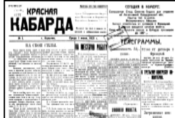
Первый печатный орган. 1921 г.