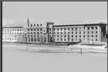
Дом Советов в Нальчике. Послевоенные годы.