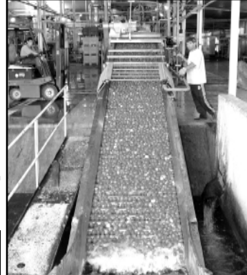
В «Агро плюс» томаты от засухи не пострадали. Зарплата консервных фирм может позавидовать многие высокооплачиваемые государственные чиновники. А столовая больше напоминает престижный элитный ресторан. Как заметила одна из работников, на своем люди приходят как на праздник. И еще одна немаловажная особенность. Как правило, капитал, вложен-