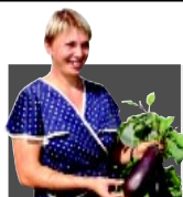
«КРАСНАЯ НИВА» ВОЗРОЖДАЕТСЯ