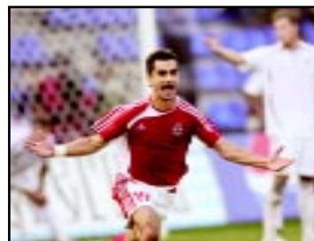
«Спартак» вышел в элиту российского футбола.