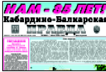
«Кабардино-Балкарская правда» - ровесница республики.