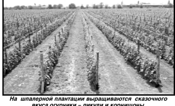
На шпалерной плантации выращиваются сказочного вкуса огурчики – пикуди и корнишоны

маты консервированные. На днях на заводе начнут выпуск продукции из фасоли, которую вырастили сами по специальной технологии. Практически фирма работает на собственном сырье. К примеру, огурчики-корнишоны здесь возделывают шпалерным способом, который также одобрен специалистами ООО «Агро плюс». Условия работы, питание и отдых работников предприятия организованы по высшему разряду. Весь процесс производства автоматизирован, на помощь пришел компьютер.