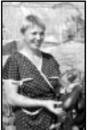
Заморский овощ баклажан растет на радость всех южан.

тепличным хозяйством (а оно занимает площадь 2,5 гектара) Любови (Гуторовой, здесь работает около 40 тепличников, причем каждая по индивидуальному плану. Никто из работников план не срывает. В «Красной ниве» содержится около 1200 голов крупного рогатого скота, из них 320 – дойное стадо. Нади молока сейчас составляют 4000 кг от каждой коровы. Хозяйство уделяло большое внимание искусственному осеменению, и это по-