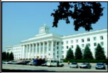
Дом Правительства. 2006 г.