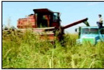
Новая техника на полях.