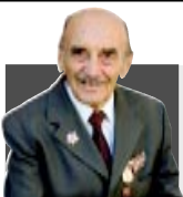
ЕГО СЛОВУ ДОВЕРЯЮТ