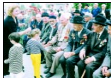
Ветераны - участники славных свершений Кабардино-Балкарии.