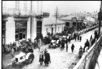
Первые тракторы в республике.