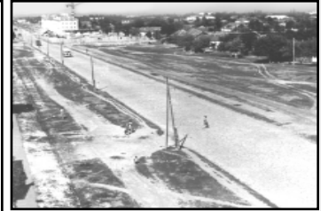
Улица Ногмова (ныне пр. им. Ленина в г. Нальчике). 1952 г.