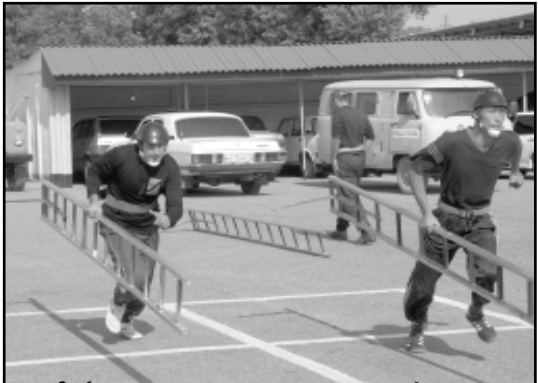
Огнеборцы показывают свое умение с помощью штурмовой лестницы.