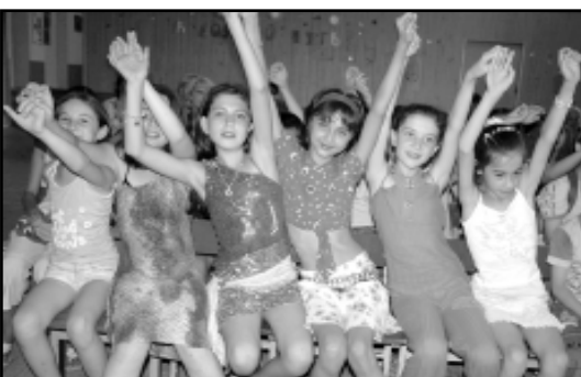
Ребята прощались с лагерем «Улыбка» и пели о нем песни.

На базе образовательного учреждения города Нальчика действует 43 лагеря детского пребывания, в которых отдыхают более 3 тысяч детей. В одном из пришкольных центров отдыха – лагере «Улыбка» школы №24 в минувшую среду детвора собралась на прощальный ужин.