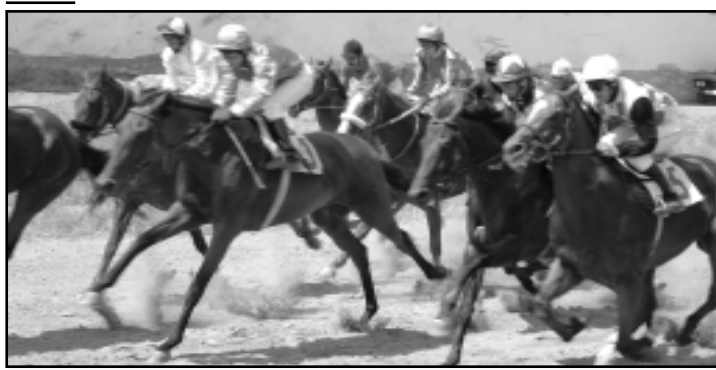
В Дерби принял участие рекордное количество лошадей.