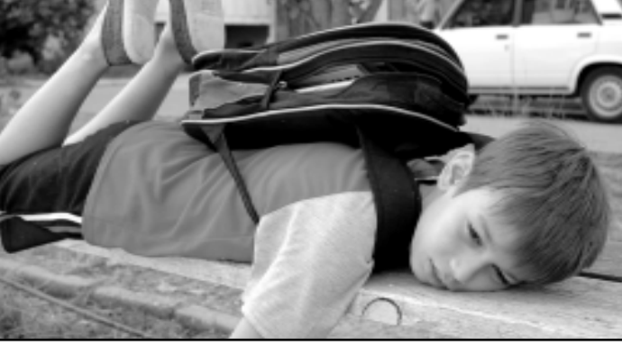
- Канкулы заканчиваются! Вот это, действительно, проблема!

Смотря чей... Но поговорим о среднестатистическом (слово-то какое!) школьнике. Если начать с книг, то сразу отложим две с половиной тысячи на книги, тетради, портфель. Потом отправимся на рынок – за одеждой. Что нужно школьнику? Костюмчик, конечно. Туфли, рубашки, белье. Это еще как минимум две с половиной тысячи. Спортивный костюмчик – еще 500 руб. Плюс рюкзаки – 600 руб. А скоро зарядят осенние дожди, и без куртки не обойтись – от 700 и выше. Сколько набралось? Семь. Какая у папы зарплата без шабашки? – Шесть. А у мамы? Она с маленьким братиком сидит, не работает. Сколько детского пособия? Сами знаете! И вообще, прожиточный минимум составляет чуть больше двух тысяч рублей. Извлекать солидарно, и нечего школьнику, наконец, купить баушные учебники, старенькую курточку в секондхенде, подлатать прошлогодичный портфель, попользоваться в него новенькие тетради и ручки и прекрасно уложиться в любой минимум. Только праздник знаний получится невеликий. Рената ЭЙВАЗОВА, Фото Камала Талгурова.