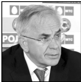
Гаджиев и Красножан – кто кого перемудрит?