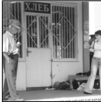
А.Б. Фото автора.

Конечно же, позже приехала милиция и «Скорая помощь», хотя помощь оказывать было уже некому. Понятно, что процедура оформления трупа занимает много времени. Но речь не о процедуре, и даже не о том, кто лежал на остановке. Почему остановку не закрыли на время процессуальных мероприятий, почему труп хотя бы не накрыли чем-нибудь? И самое главное «почему». Люди, когда мы перестали замечать, что человек умирает на улице? Все эти вопросы, понятно, риторические, но кажется, что никому из нас не должно становиться плохо на улице, и не дай нам Бог умереть где-то в неполюженном месте. Каждый умирает в одиночку.