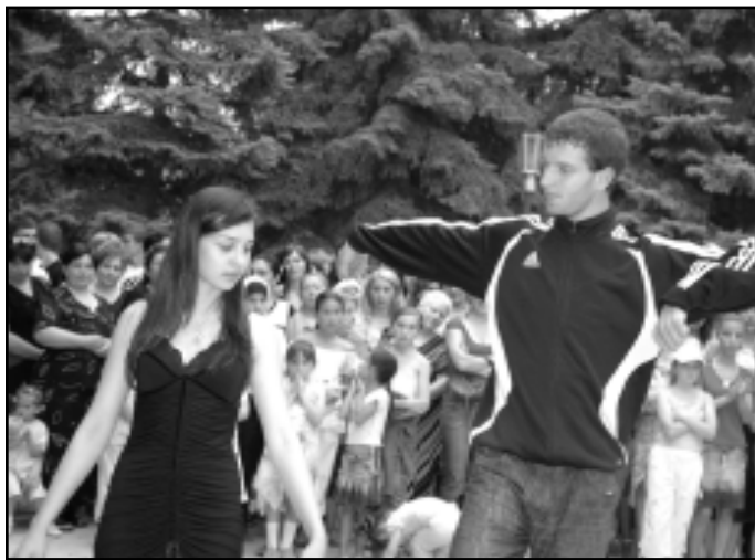
Стать и грация.

лись два месяца, в течение которых милиция держала их в напоре.