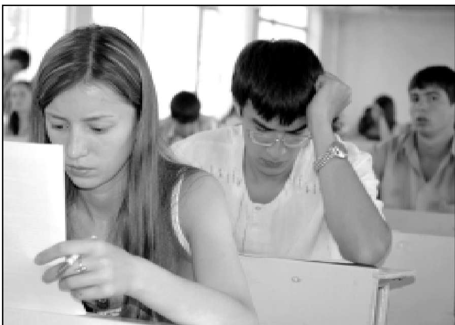
И кто только составил этот тест?