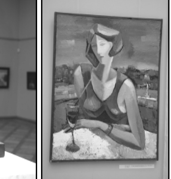
Поэза. «Утро одинокой женщины».