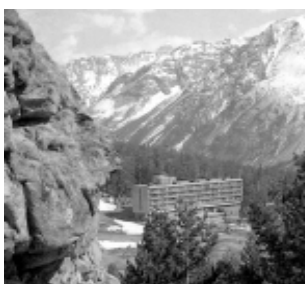
Здесь будет Шема для туристов.