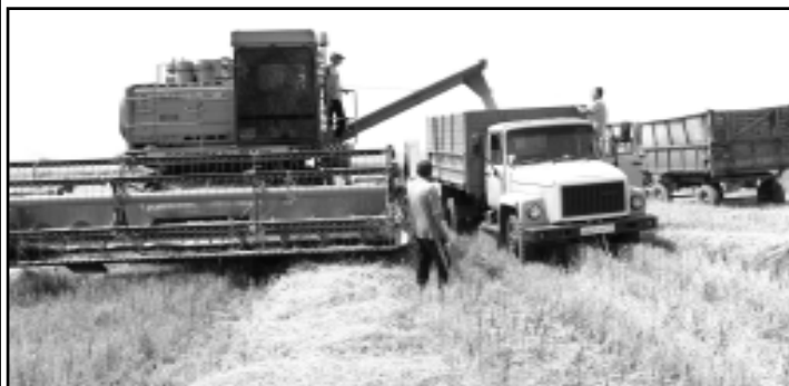
Экипаж Арсена Тумова завершил последний круг на пшеничном поле ЗАО Р НП «Шаджэм».