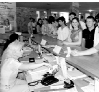
У абитуриентов, немало вопросов к членам приемной комиссии.