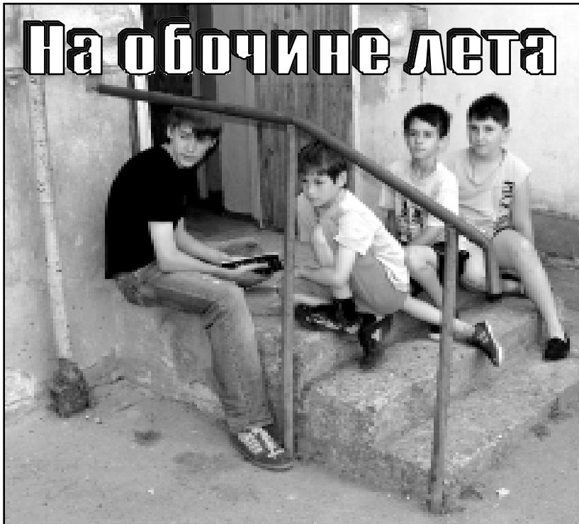
Чем они займутся через минуту, через час..?