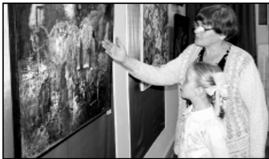
Повезло юной посетительнице с такой бабушкой.