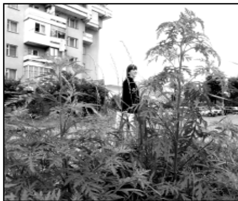
Куст амброзии, который еще пока не опасен.

Зинаида МАЛЬБАХОВА.