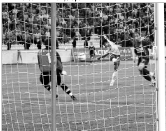
Пушечный удар Корчагина оставил не у дел Чичкина.

Результаты остальных матчей: «ЦСКА» - «Торпедо» - 2:0; «Зенит» - «Динамо» - 0:0; «Локомотив» - «Сатурн» - 0:0; «Спартак» ИЧ - «Ростов» - 3:1; «Луч-Энергия» - «Крылья Советов» - 3:2; «Москва» - «Шинник» - 4:1